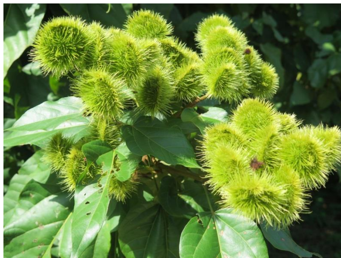
คำไทยดอกเขี้ยว