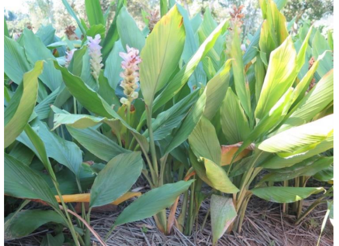
ปทุมมาบัวจีน