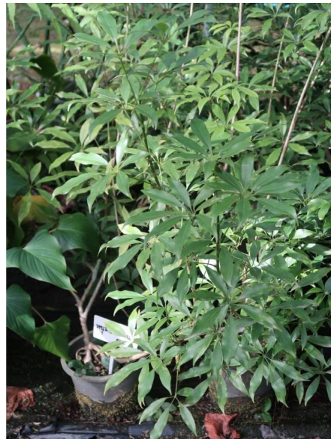
หนุ่ฆานประสากาย