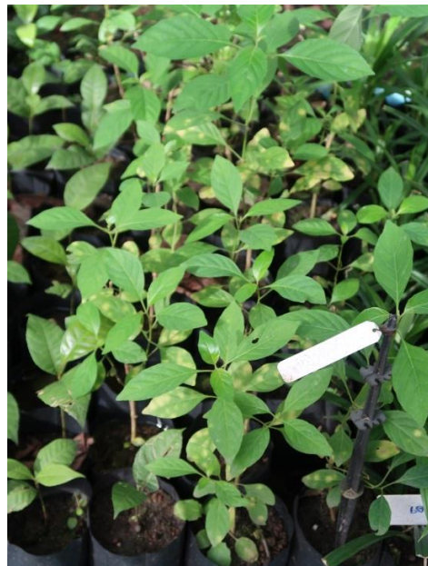
ทองพันชั่ง