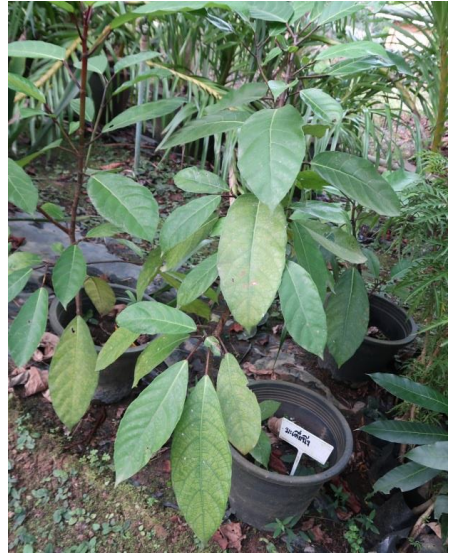
มะเดื่อฝรั่ง