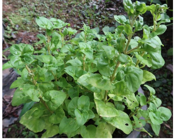
วอเตอร์เครส