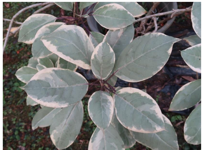
ล้าโพงกาลัก