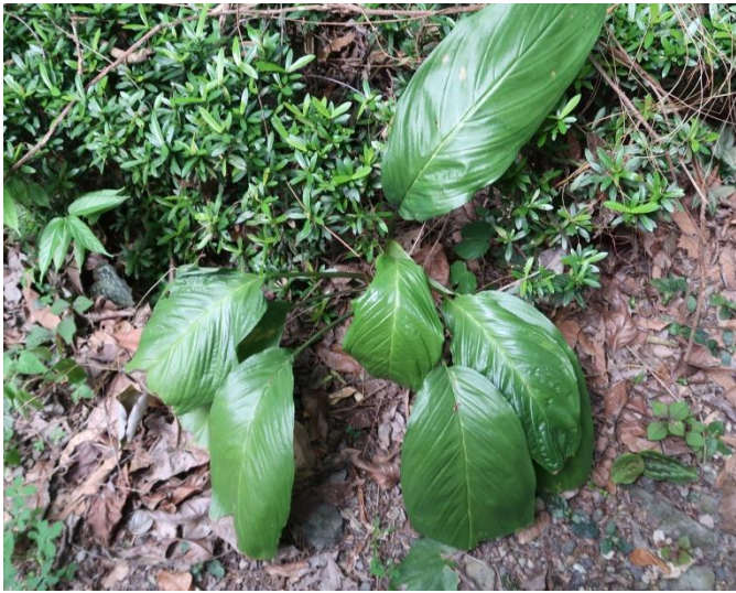
ค้ำคาวดำ