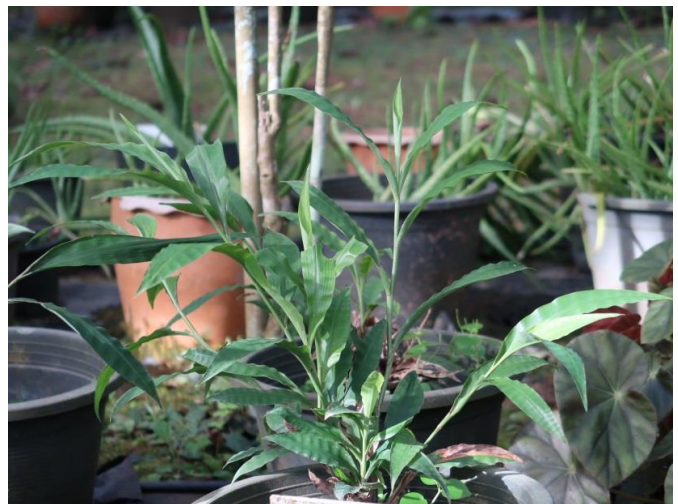
หญ้ารี่แพร