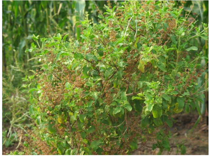
กระเพราพื้นบ้าน