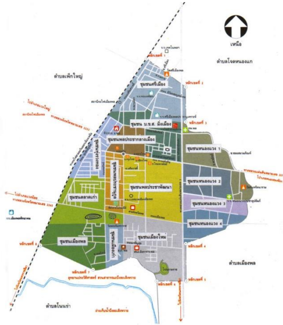
แผนที่อำเภอพล

เมืองพลโนนแท่นพระ สักการะพระเจ้าใหญ่ อ่างน้ำละเลิงหวาย ค้าขายกว้างไกล น้ำใจมากล้น ชนชาตินักรบ ทำนบภูดิน เทียวถิ่นทุ่งพึงพิศ