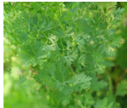
ผักชีจีน