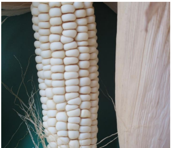
ข้าวโพดข้าวเหนียว (บ้านหนองมะเขือ)