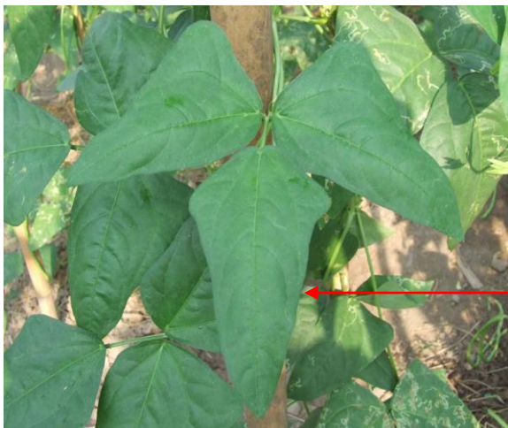
ใบย่อยส่วนปลาย (terminal leaflet)