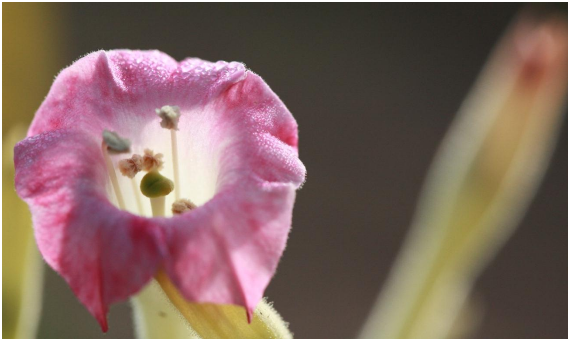
ยาสูบพันธุ์เอ็มเจวีศูนย์สอง (MJV02)