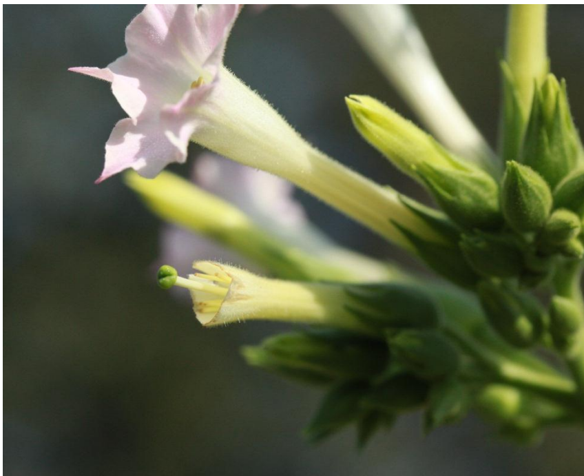
ยาสูบพันธุ์เอ็มเจบีศูนย์หนึ่ง (MJB01)