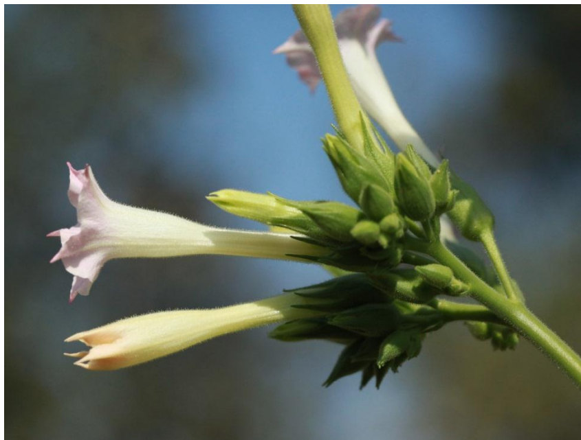
ยาสูบพันธุ์เอ็มเจวีศูนย์หนึ่ง (MJV01)