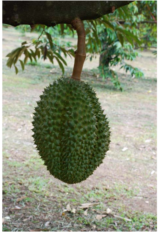
ทุเรียน พันธุ์นวลทองจันทร์