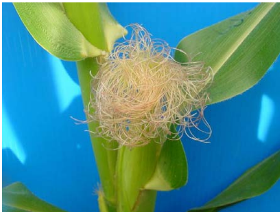
ไหมเริ่มโผล่