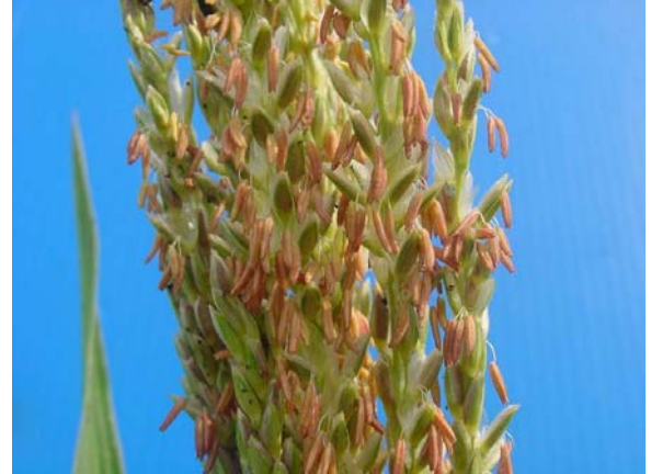
ดอกเพศผู้และละอองเกสร