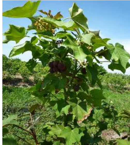
ต้น- ทรงพุ่ม