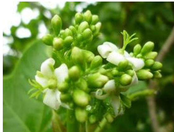
ดอกตัวเมีย