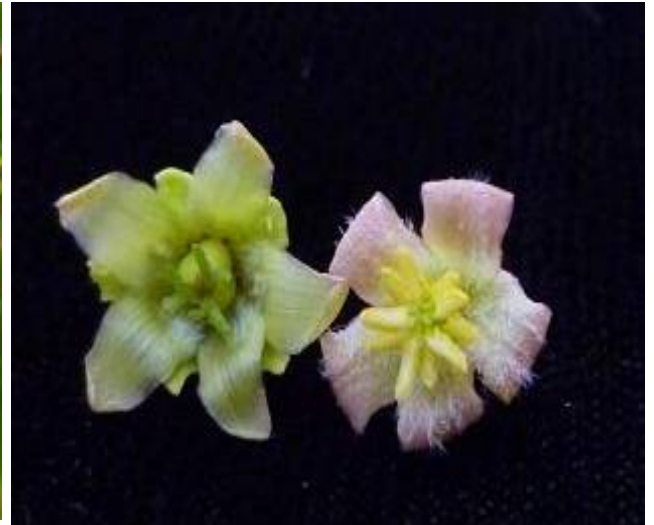
ดอกตัวเมีย - ดอกตัวผู้