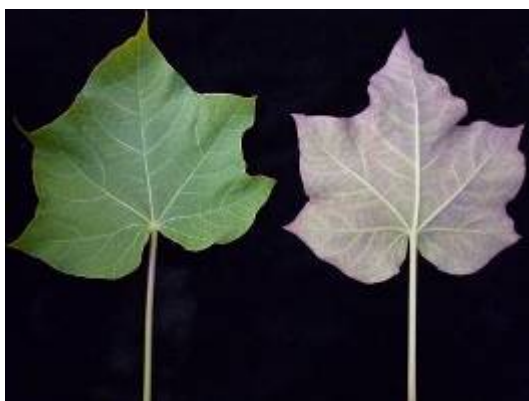
การเรียงตัวของใบ