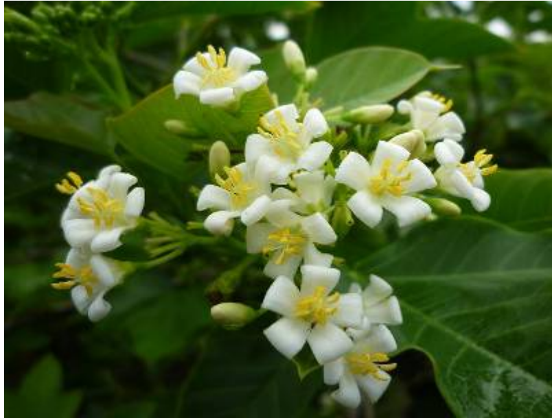
ลักษณะช่อดอก

ดอก (Flower) ช่อดอกแบบกระจุกแยกแขนง (panicle cyme) ประกอบด้วยดอกตัวผู้และดอกตัวเมียในช่อเดียวกัน ดอกมีกลิ่นหอม**