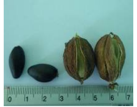
เมล็ด- ผลแห้ง การปรีแตก