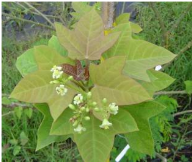
การเรียงตัวของใบ