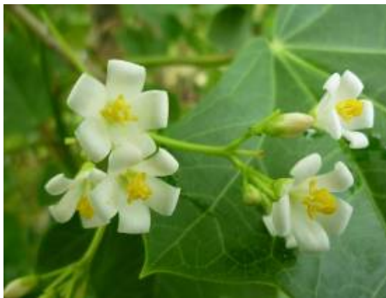
ดอกตัวผู้