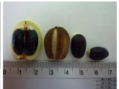
เมล็ด- ผลแห้ง