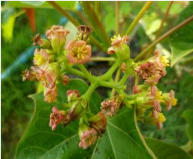
ลักษณะช่อดอก

ดอก (Flower) ช่อดอกแบบกระจุกแยกแขนง (panicle cyme) ประกอบด้วยดอกตัวผู้และดอกตัวเมียในช่อเดียวกัน