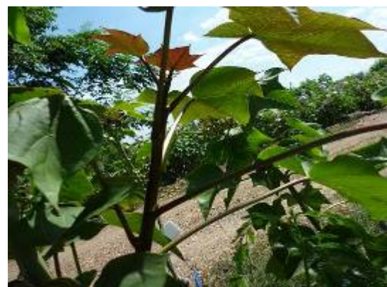
ผิวใบบน- ผิวใบล่าง