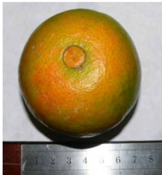
ส้มเขียวหวานเปลือกอ่อนพันธุ์ลำค่า