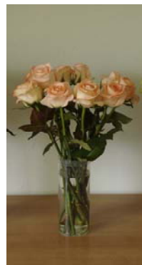
บรรจุแบบแห้ง