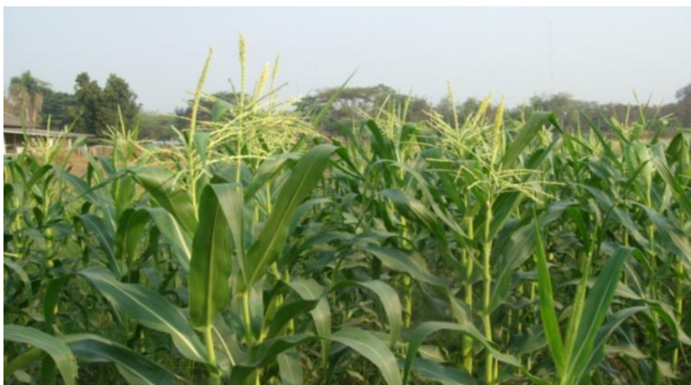
ภาพ ต้นและช่อดอกตัวผู้ของข้าวโพดหวานพันธุ์ชัยนาท 1 (CNSH 7550)