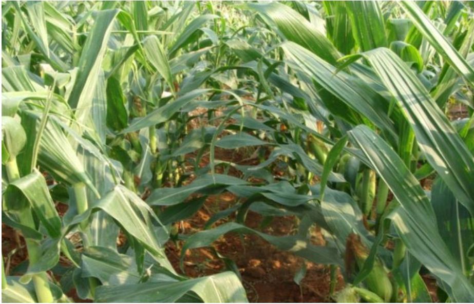
ภาพ ต้นและฝักของ ข้าวโพดหวาน พันธุ์ชัยนาท 1 (CNSH 7550)