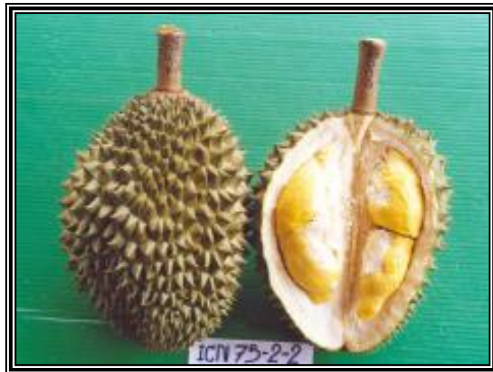
ภาพแสดงลักษณะผล และเนื้อทุเรียนลูกผสมพันธุ์จันทบุรี 2