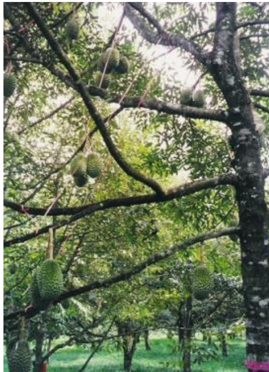
ภาพแสดงลักษณะต้น ใบ และผลของทุเรียนลูกผสมพันธุ์จันทบุรี 2