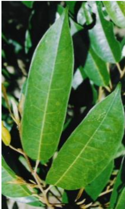
ภาพแสดงลักษณะต้น ใบ และผลของทุเรียนลูกผสมพันธุ์จันทบุรี 3