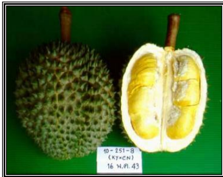
ภาพแสดงลักษณะผล และเนื้อทุเรียนลูกผสมพันธุ์จันทบุรี 3