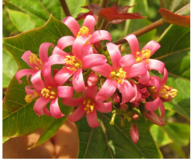
ลักษณะดอกและช่อดอกของสับดูดำพันธุ์กำแพงแสน 4