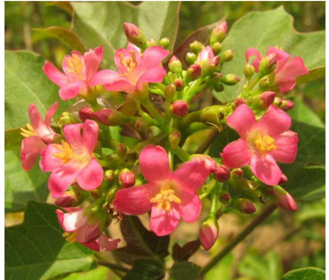
ลักษณะดอกและช่อดอกของสบู่ดำพันธุ์กำแพงแสน 5