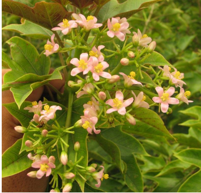
ลักษณะดอกและช่อดอกของสบู่ดำพันธุ์กำแพงแสน 6