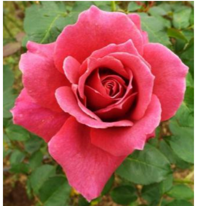
กุหลาบพันธุ์ภูฟิงค์ 1