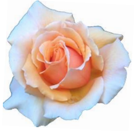
พ่อ Just Joey