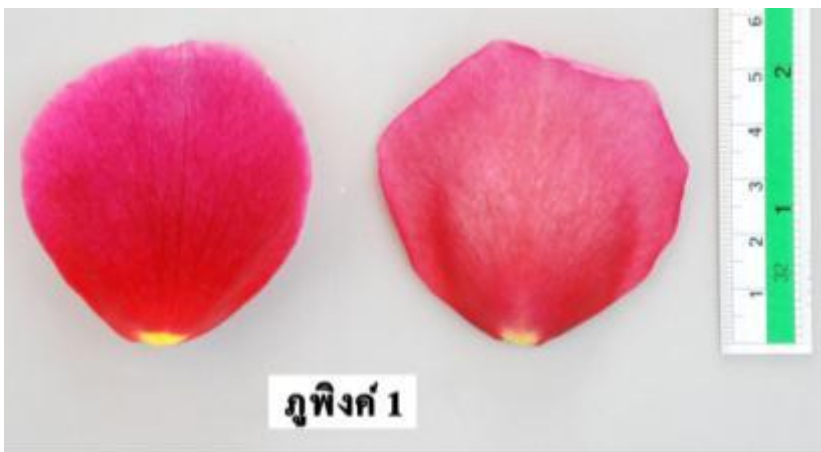
กุหลาบพันธุ์กุฟิงค์ 1