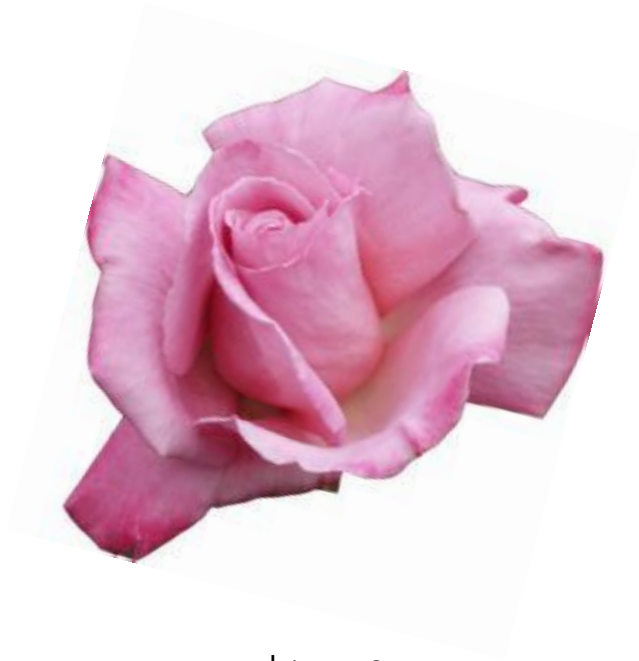
แม่ Azure Sea