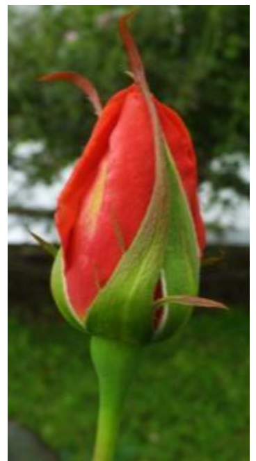
กุหลาบพันธุ์ภูฟิงค์ 2