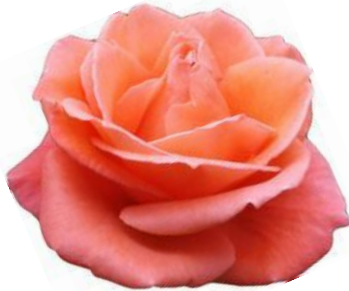
Diagram แสดงการผสมพันธุ์กุหลาบภูฟิงค์ 2