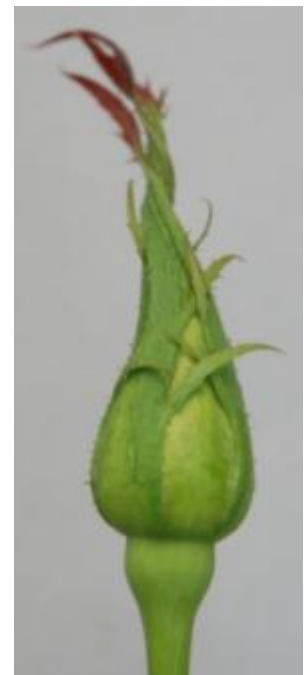
กุหลาบพันธุ์รูปที่ 2