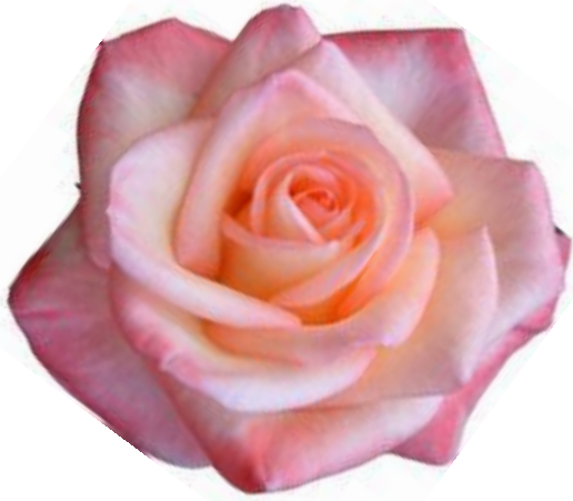
แม่ Anne Morrow Lindbergh