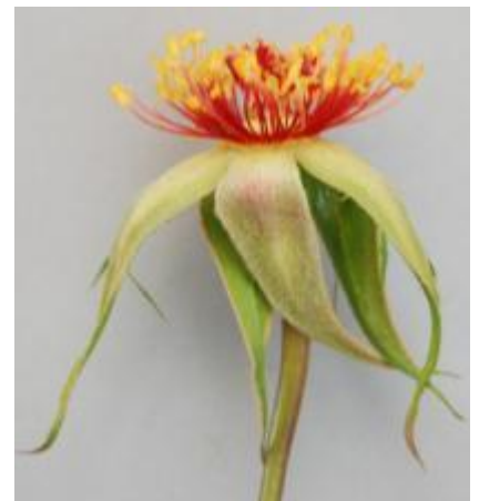
กุหลาบพันธุ์กุพิงค์ 2