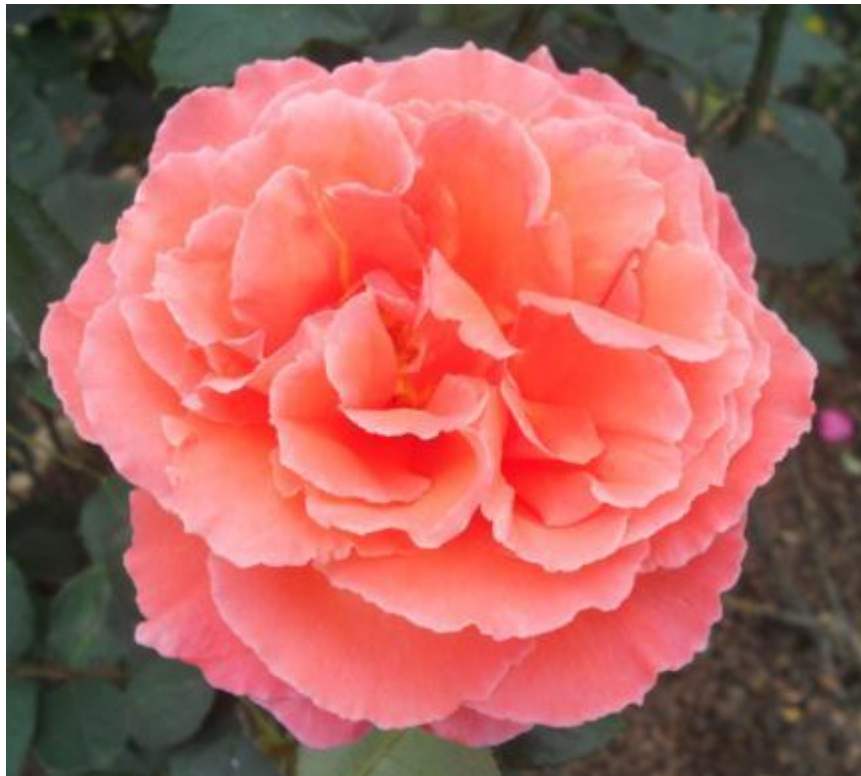
กุหลาบพันธุ์ภูฟิงค์ 3