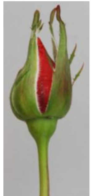
กุหลาบพันธุ์กุฟิงค์ 3