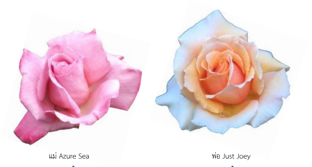
แม่ Azure Sea