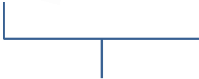
พ่อ Just Joey