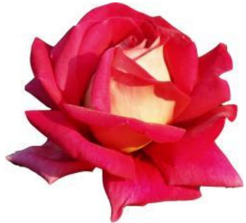
พ่อ Flaming Peace