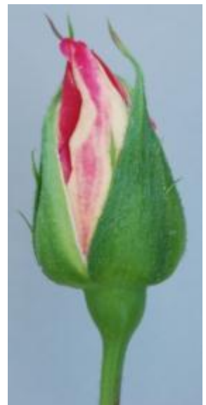
กุหลาบพันธุ์กุพิงค์ 8