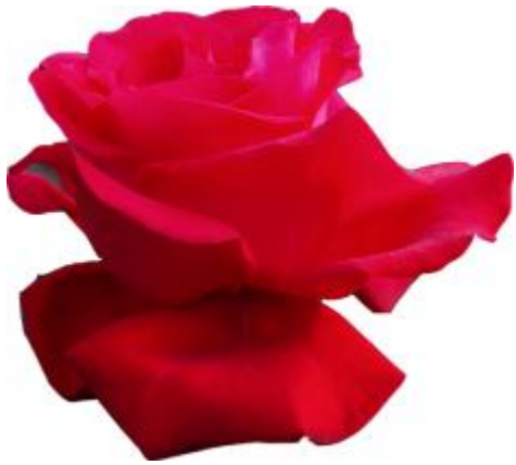
แม่ La Marseillaise