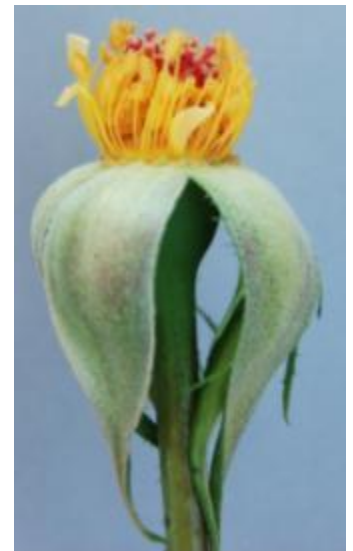
กุหลาบพันธุ์ภูพิงค์ 8