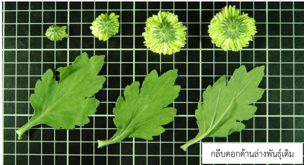
กลีบดอกด้านล่างพันธุ์เดิม