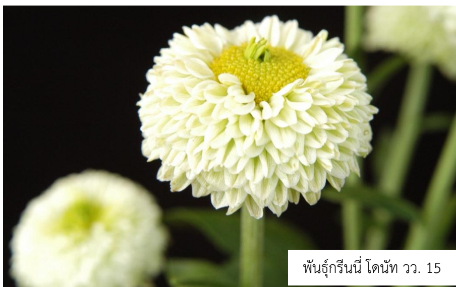
พันธุ์กรีนนี่ โดนท์ วว. 15

เบญจมาศพันธุ์กรีนนี่ โดนท์ วว. 15 (Greeny Donut TISTR 15)