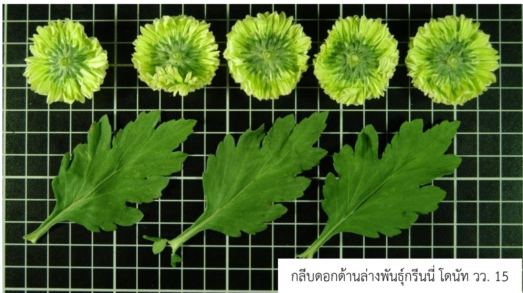
กลีบดอกด้านล่างพันธุ์กรีนนี่ โดนท์ วว. 15