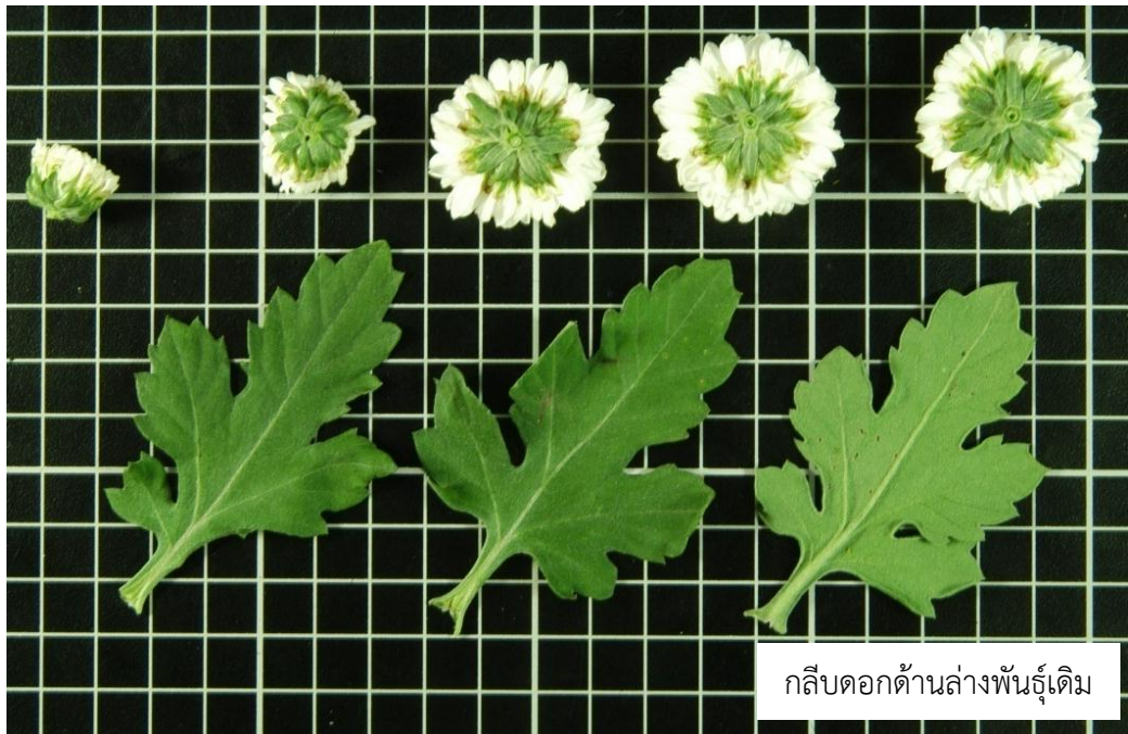
กลีบดอกด้านล่างพันธุ์เดิม