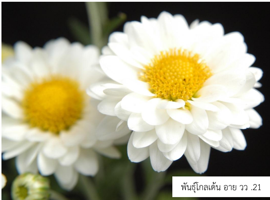
เบญจมาศพันธุ์โกลเด้น อาย วว. 21 (Golden Eye TISTR 21)