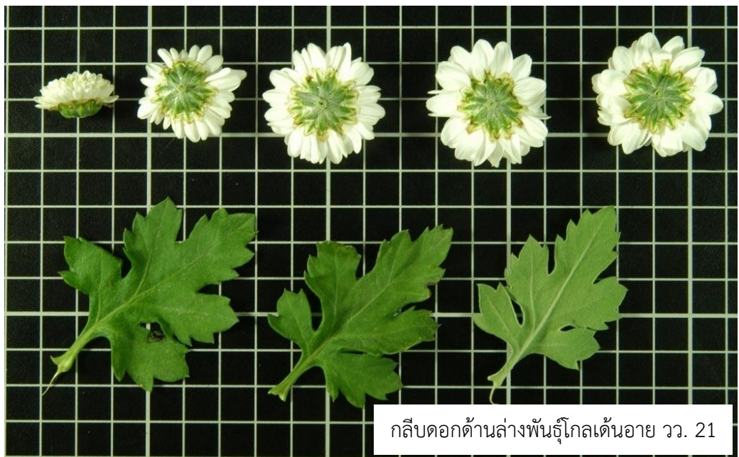
กลีบดอกด้านล่างพันธุ์โกลเด้นอาย วว. 21