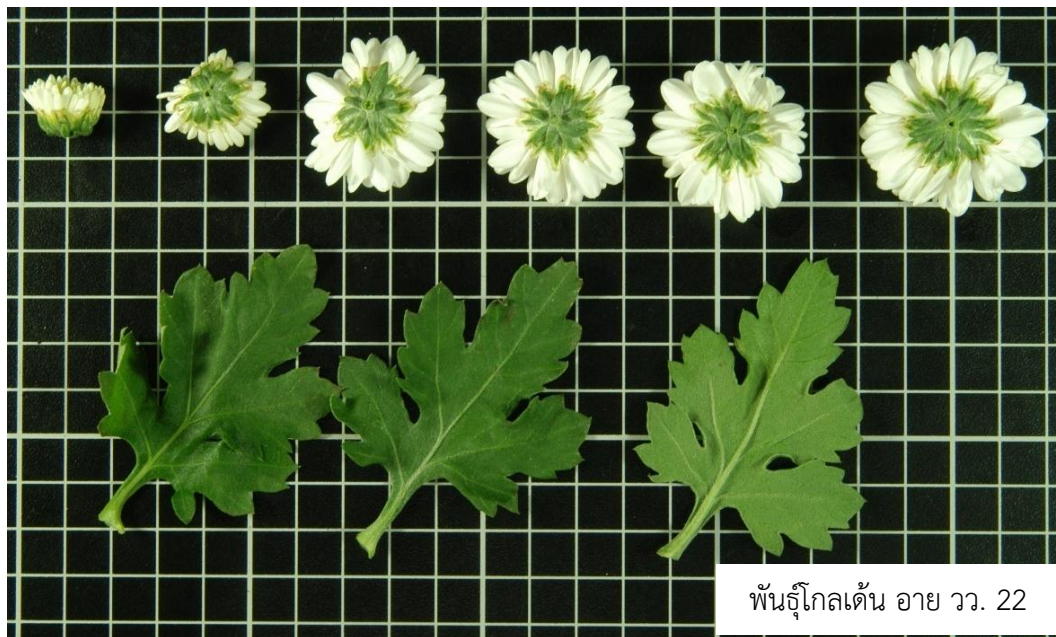
พันธุ์โกลเด้น อาย วว. 22