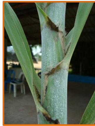
หูใบและคอใบ