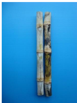
ปล้องและการเรียงตัว