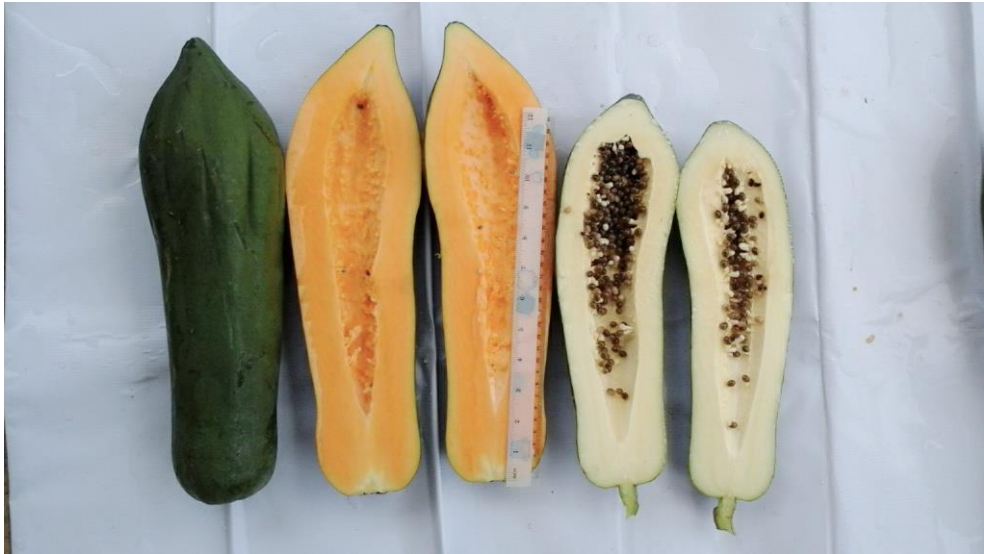
มะละกอพันธุ์อาร์เอ็มยู 1