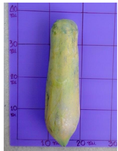
มะละกอพันธุ์อาร์เอ็มยู 1