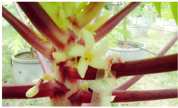
มะละกอพันธุ์อาร์เอ็มยู 2