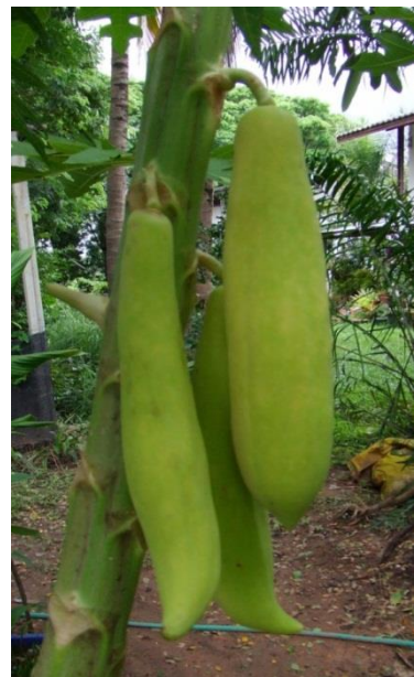
มะละกอพันธุ์อาร์เอ็มยู 3