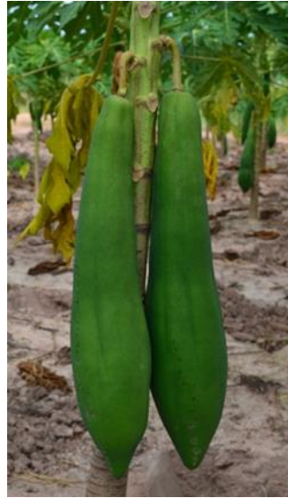
ลักษณะดอกและผล