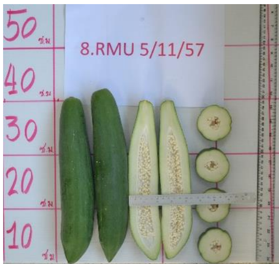
ลักษณะผลดิบ