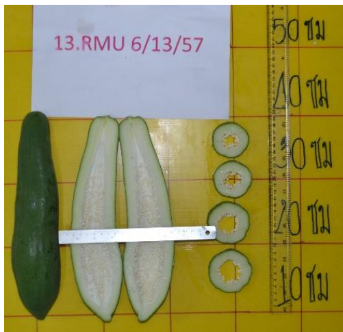
ลักษณะผลดิบ