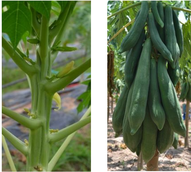
ลักษณะดอกและผล