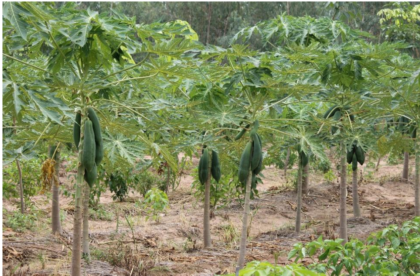
ลักษณะต้นและใบ