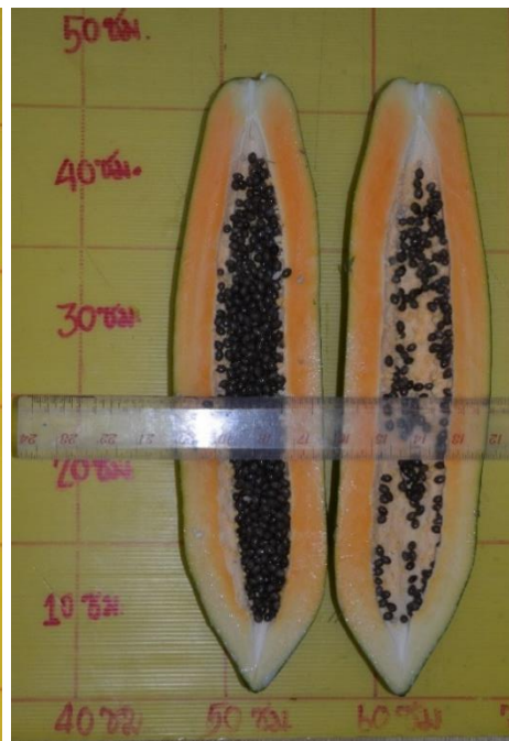
ลักษณะผลสุก