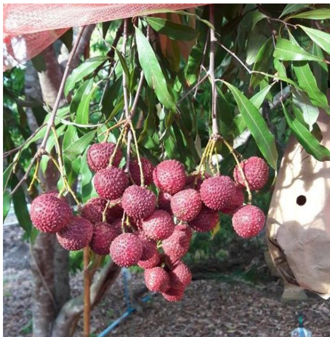
ลีนจีพันธุ์ค่อมบุญมา