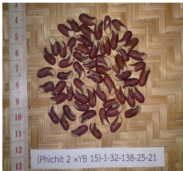
ถั่วฝักยาวพันธุ์ (พิจิตร 2 x YB 15) - 1 - 32 - 138 - 25 - 21