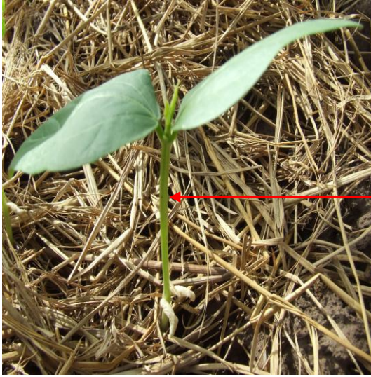
ลำต้นใต้ใบเลี้ยง (hypocotyl)