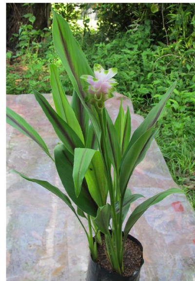
ไม้ดอกสกุลขมิ้น (ลูกผสมปทุมมา) พันธุ์เซียงรายซีเอฟ 7