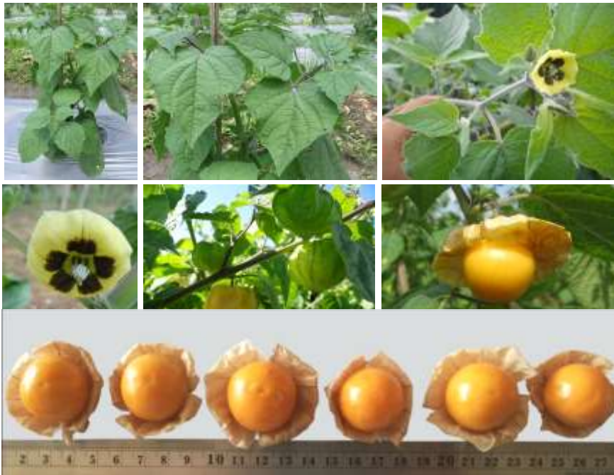
เคพกูสเบอร์รี่พันธุ์เหลืองทอง