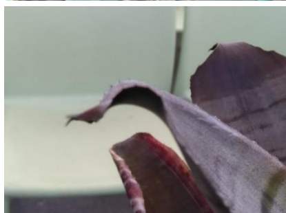
สับประรดสีพันธุ์อ็อตโต้ (Otto)