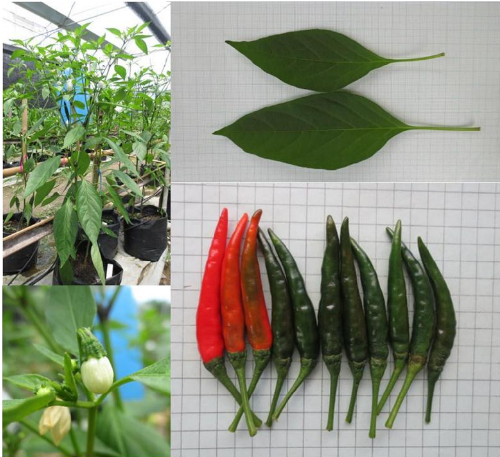
พริกพันธุ์ซี_73 (C_73)

หมายเหตุ : ใช้การจำแนกลักษณะตาม Capsicum descriptors ตาม IPGRI (1995)