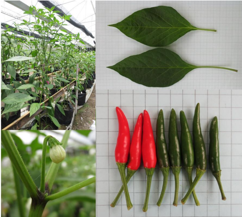
พริกพันธุ์ซี_87 (C_87)

หมายเหตุ : ใช้การจำแนกลักษณะตาม Capsicum descriptors ของ IPGRI (1995)