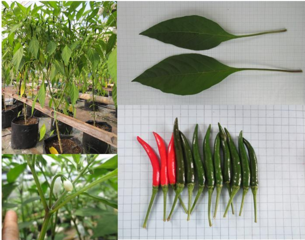
พริกพันธุ์ซี_99 (C_99)

หมายเหตุ : ใช้การจำแนกลักษณะตาม Capsicum descriptors ของ IPGRI,1995