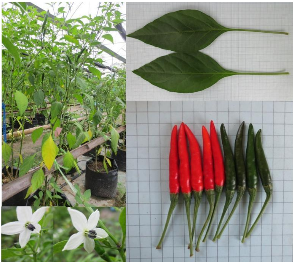
พริกพันธุ์จี01 (G01)

หมายเหตุ : ใช้การจำแนกลักษณะตาม Capsicum descriptors ของ IPGRI (1995)