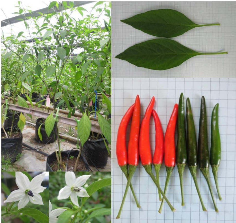
พริกพันธุ์จี09 (G09)

หมายเหตุ : ใช้การจำแนกลักษณะตาม Capsicum descriptors ของ IPGRI (1995)