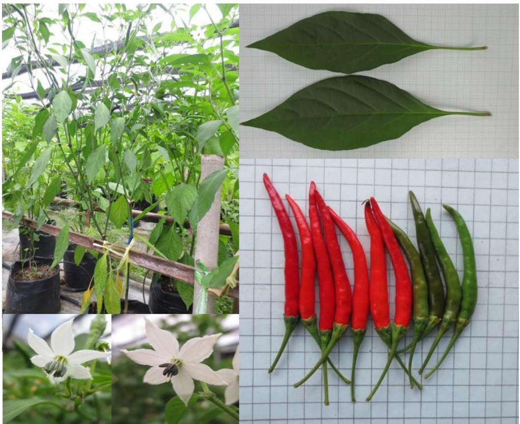
พริกพันธุ์จี44 (G44)

หมายเหตุ : ใช้การจำแนกลักษณะตาม Capsicum descriptors ของ IPGRI (1995)