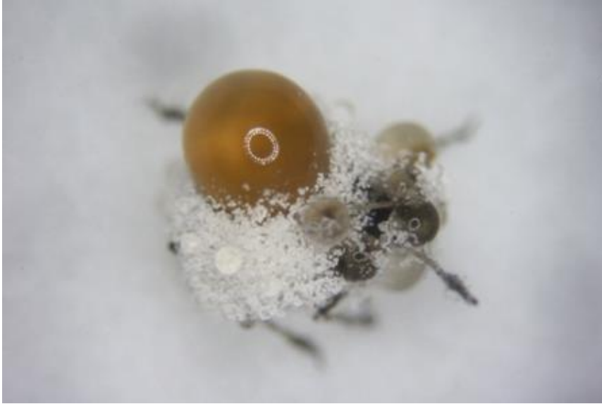
ภาพที่ 1 เพลี้ยอ่อนดำติดเชื้อเชื้อราบิวเวอเรีย (สายพันธุ์กรมวิชาการเกษตร) ไอโซเลท B4