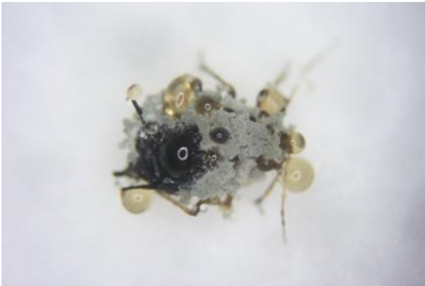
ภาพที่ 2 เพลี้ยอ่อนดำติดเชื้อเชื้อราเขียวเมตาโรเซียม (สายพันธุ์กรมวิชาการเกษตร) ไอโซเลท M1