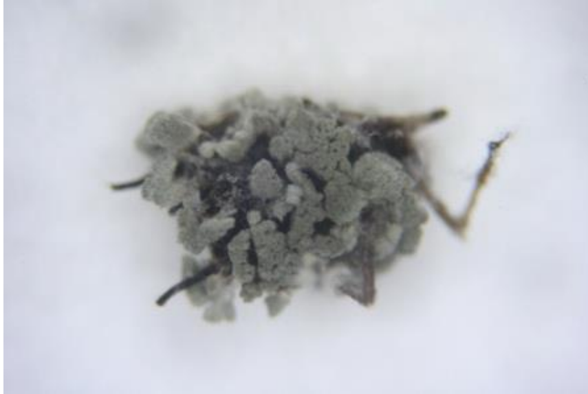
ภาพที่ 3 เพี้ยอ่อนดำติดเชื้อเชื้อราเขียวเมตาโรเซียม (สายพันธุ์กรมวิชาการเกษตร) ไอโซเลท M8