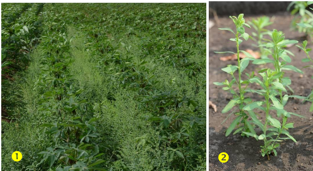
Figure1 Habitat of Phyllanthus caroliniensis Walter (1) (2)