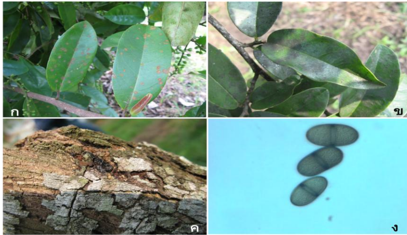
ภาพที่ 1: โรคมะเฒ่าที่พบใน อำเภอกุฉินารายณ์ จังหวัดสกลนคร