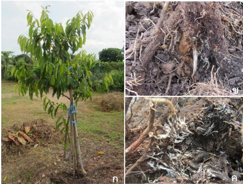
ภาพที่ 3: อาการต้นโทรมของมะเเฒ่า ที่พบใน อำเภอภูพาน จังหวัดสกลนคร