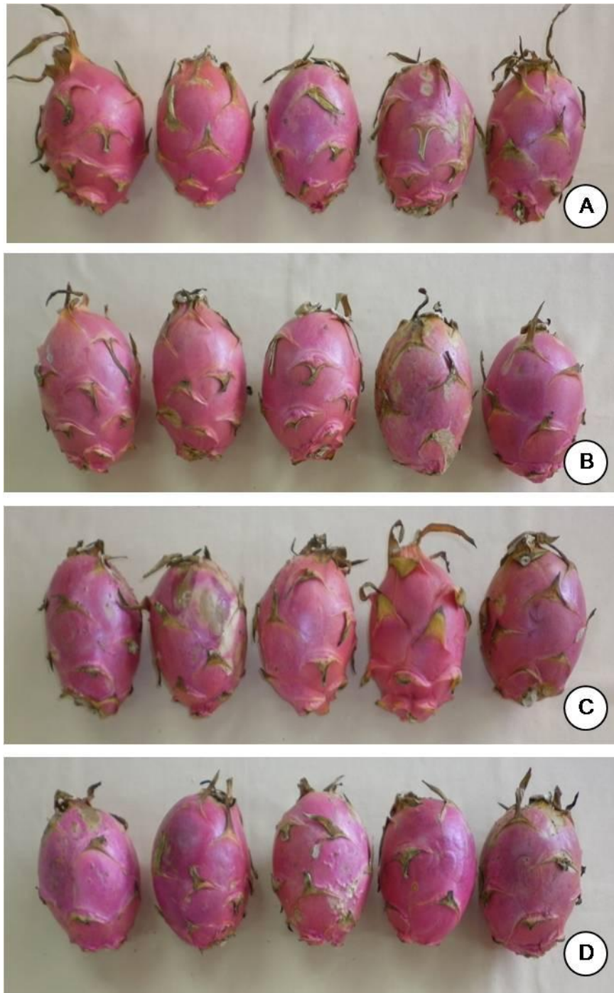
Figure 1 Dragon fruit after treated with MVHT at 47 °C for various holding time followed by water cooling and store at 10 \pm 1^{\circ}\text{C} for 7 days

A : Control B: 47 °C for 0 hr. C: 47 °C for 1 hr. D: 47 °C for 2 hr.