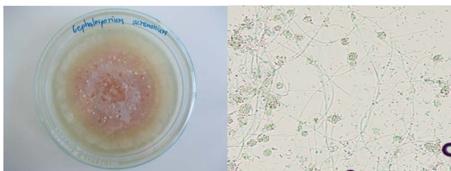
ภาพที่ 1 ลักษณะเชื้อสาเหตุโรค Cephalosporium acremonium บนอาหารเลี้ยงเชื้อ potato dextrose agar