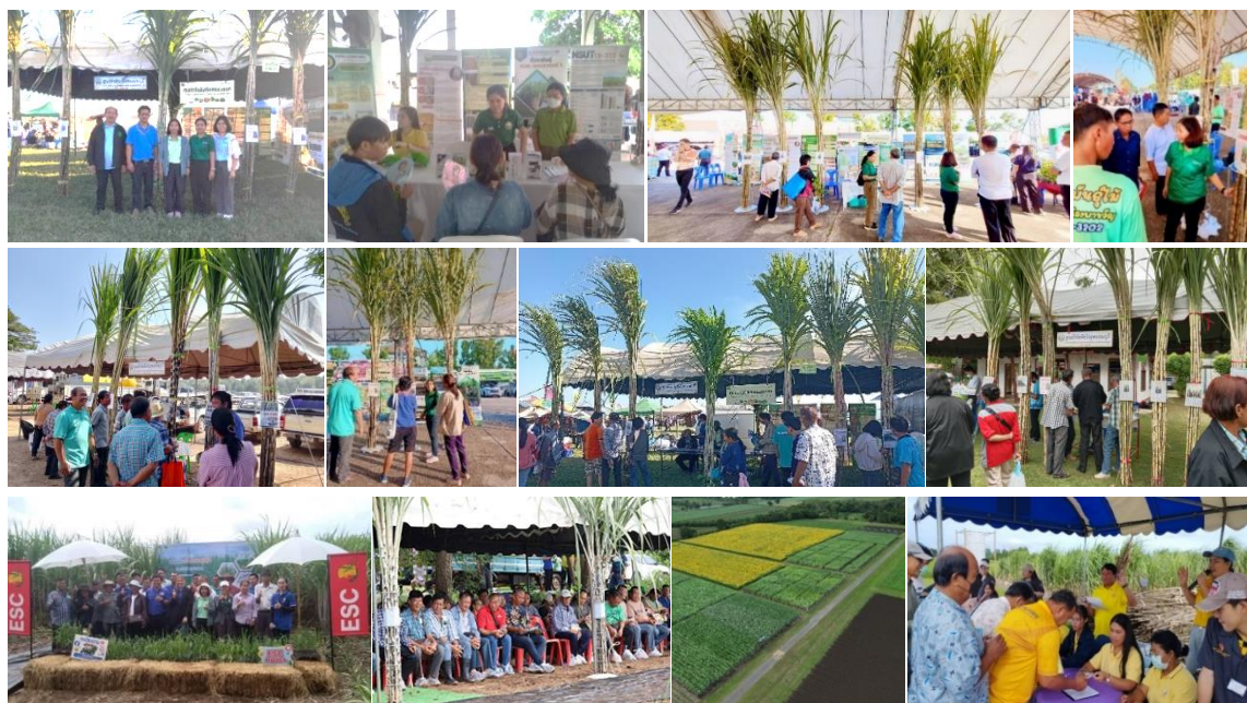
Figure 4 Extending the utilization of sugarcane variety DOA Nakhon Sawan1 to farmers, sugarcane grower associations, and sugar mills