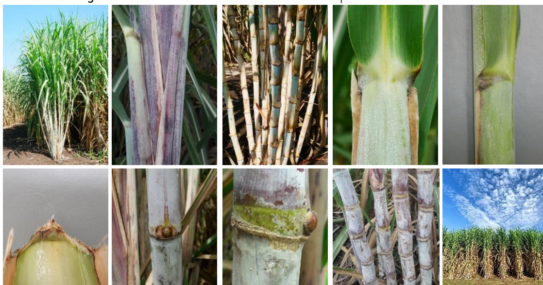
Figure 2 Characteristics of sugarcane variety DOA Nakhon Sawan1