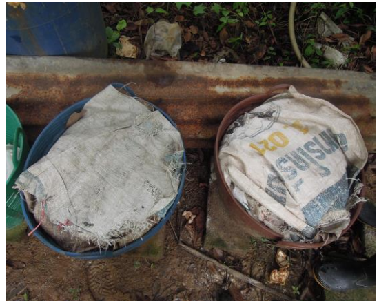
การหมักโกโก้