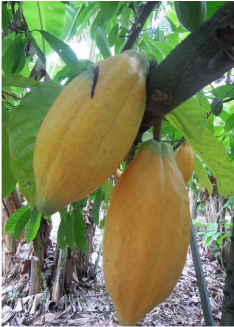
ฝักโกโก้ที่พร้อมเก็บเกี่ยว