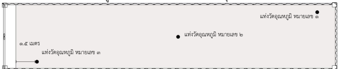
ภาพที่ ๑ ตำแหน่งการวางแห่งวัดอุณภูมิผลไม้ภายในตู้ขนส่งสินค้าสำหรับการกำจัดศัตรูพืชด้วยความเย็นระหว่างขนส่ง