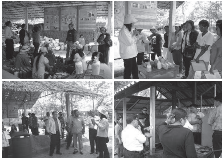
การศึกษาดูงานจากหน่วยงานราชการ เอกชน และเกษตรกรที่สนใจ