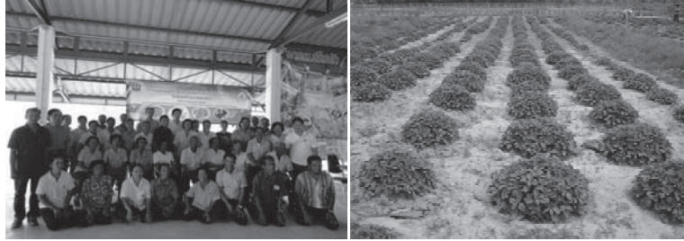
การฝึกอบรมหลักสูตร การปลูกพืชไร่เสริมรายได้ (ถั่วหรั่ง มันขี้หนู และถั่วลิสง) ในพื้นที่จังหวัดสงขลา