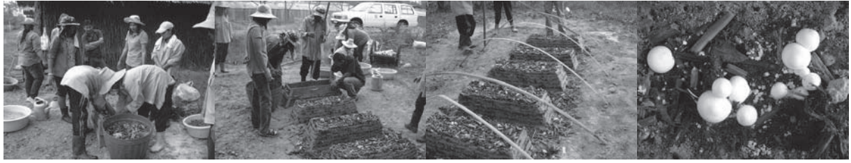
สาธิตการเพาะเห็ดฟางกองเตี้ยด้วยผักตบชวาสด และขี้เลื่อย/ขี้เลื่อยใช้แล้ว