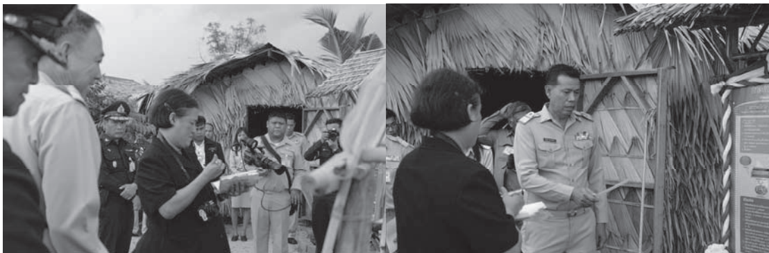
การรับเสด็จฯ สมเด็จพระเทพรัตนราชสุดาฯ สยามบรมราชกุมารี วันที่ ๒๔ สิงหาคม ๒๕๕๔