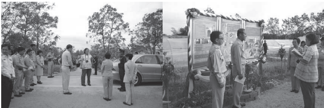
การรับเสด็จฯ สมเด็จพระเทพรัตนราชสุดาฯ สยามบรมราชกุมารี วันที่ ๑๐ มกราคม ๒๕๕๔

โครงการฟาร์มตัวอย่างตามพระราชดำริ ตำบลคลองหอยโข่ง อำเภอคลองหอยโข่ง จังหวัดสงขลา